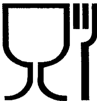
Рис. 1. Упаковка (укупорочные средства), предназначенная для контакта с пищевой продукцией

Список изменяющих документов (в ред. решения Совета Евразийской экономической комиссии от 18.10.2016 N 96)